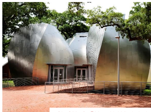
Ohr O'Keefe @Memphis&Mississippi

Nuit au White House Hotel (ou similaire si non disponible à la réservation)