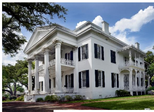
Stanton Hall @Memphis&Mississippi

Nuit au Hampton Inn (ou similaire si non disponible à la réservation)