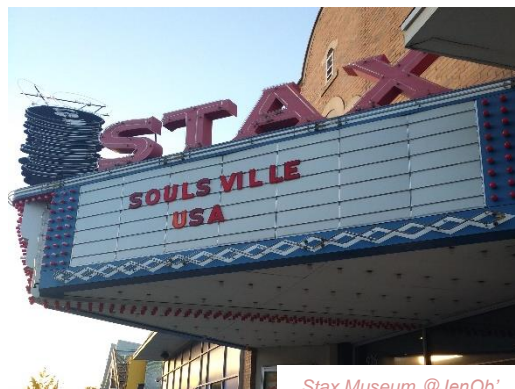
Stax Museum

Situé à la porte du delta du Mississippi, « Bluff City » comme on la surnomme doit sa fortune au coton et au trafic fluvial mais c'est avant tout la musique qui a fait la renommée de Memphis. Flânez le long de Beale Street, avenue vivante et artistique de la ville reconnaissable avec ses enseignes néon. La musique est omniprésente dans la ville mais également le sport et la gastronomie. Memphis est également connue pour y abriter Graceland, dernière résidence du King, et le Lorraine Motel, le lieu où Martin Luther King Jr a été assassiné. Celui-ci est dorénavant devenu un Musée National des Droits Civiques dans lequel vous pourrez écouter divers enregistrements multimédias afin de retracer cette époque de l'histoire. Prenez quelques jours afin de parcourir les nombreux musées, et vous laisser bercer une dernière fois par le rythme du Mississippi. Nuit à l'Holiday Inn (ou similaire si non disponible à la réservation)