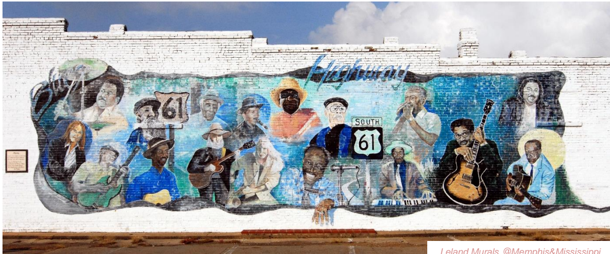
Leland Murals @Memphis&Mississippi

13 jours au départ de New Orleans – 12 nuits d'hôtels