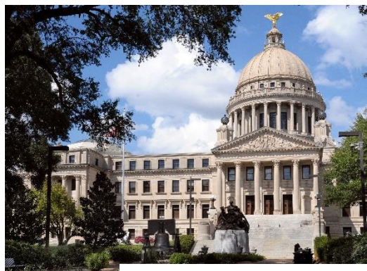
State Capitol @Memphis&Mississippi

Partez ensuite vers la capitale du Mississippi, Jackson. La « City with soul » regorge de hauts lieux historiques tels que le Capitole, le State Historical Museum ou encore le Mississippi Civil Rights Museum. Faites un véritable bond dans le temps et découvrez l'histoire et le passé de Jackson. Retrouvez son emblématique Capitole, lieu de légendes avec entre autres, la promulgation des premières lois permettant aux femmes mariées d'accéder à la propriété (1839), la Sécession de l'état (1861), l'élection d'Hiram Revels, le premier sénateur noir (1870), la remise de la Légion d'Honneur française à l'écrivaine Eudora Welty (1996) !